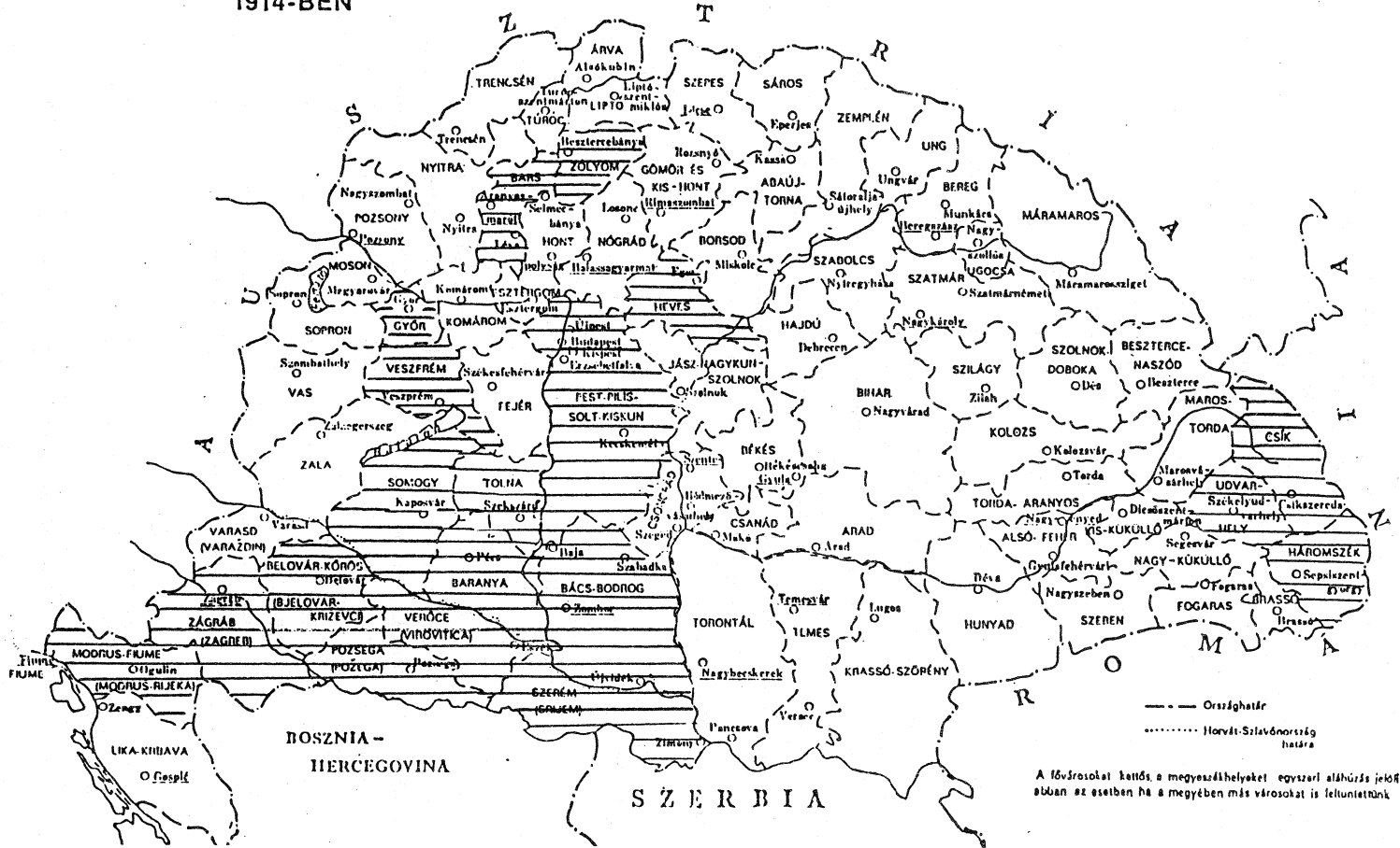
4. ábra. Az Angster orgonagyár síprekonstrukciós területe