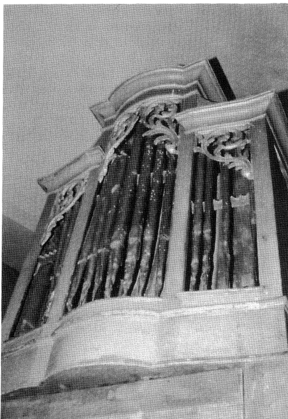
1. kép Az orgona hiányos homlokzata

Nem derül ki azonban sem a kissomlyói iratokból, sem pedig Szigeti Kilián kutatásaiból, hogy a régi orgonát Angsterék hol állíthatták fel ismét. Az 1796-ban épített Klügel-orgonának tehát itt egyelőre nyoma veszett. 38