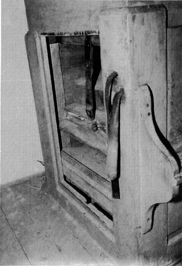
3. kép A szíjhúzásos ékfívók

tosabb kissomlyói eseményekről: „Emlékeztető. Az Úrnak 1796-os esztendejében ezt az orgonát készítette a Kissomlyói Evangélikus Egyház az ugyanazon egyházhoz leányegyházként hozzátartozó helységekkel, úgymint Duka, Hetye, Borgáta, Káld és Nagykötsk, 300 forintért. Felállított a templomban a fent említett évben, a virágvasárnap utáni napokban. Az első orgonista Bene-