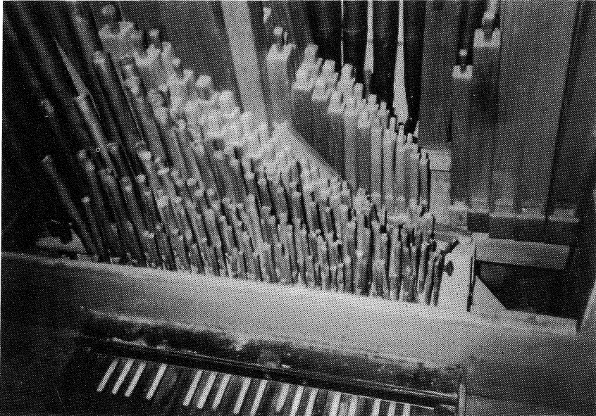
5. kép Az orgona belső sípjai