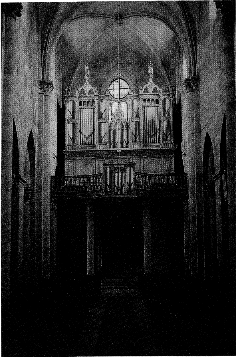
A gyulafehérvári székesegyház orgonájának homlokzata.