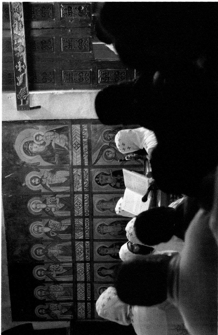
2. ábra: A Szent Bisoj-templom szentélyrekesztője Iszaak Fanousz freskóival (1957), az előtte álló evangélium-felolvasó állományra helyezett könyvvel szerzetesek egy csoportja énekel. Jobb oldalon a középső szentély VII. századi, finom díszítésű fakapuja látszik; ajtaja a liturgia során nyitva van.