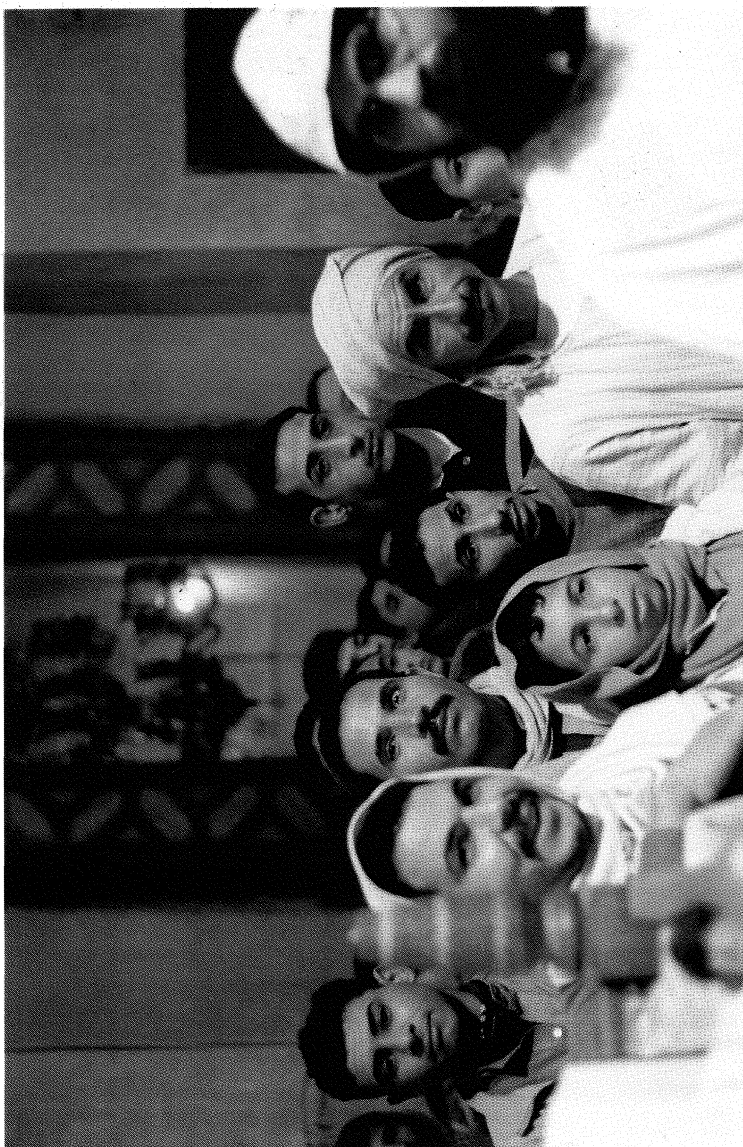
3. ábra: a Szent Biszaj-kolostor alkalmazottai a karácsonyi vigltán, a kórus laikusoknak fenntartott bal oldalon; a bal sarokban a „leckeoldali” felolvasóáltoány, hátul közepen a főhajóra nyíló, óegyiptomi stílusú, hatalmas kapu (az 5. ábrán a 6-os és a 4-es szám között), annak ajtaján át a főhajó látszik.