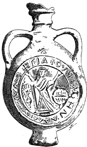
1. ábra. Kerámia-ampulla Szent Tekla képmásával. Fernand Cabrol: Dictionnaire d'archéologie chrétienne et de liturgie. Paris 1907. VII. 1732.