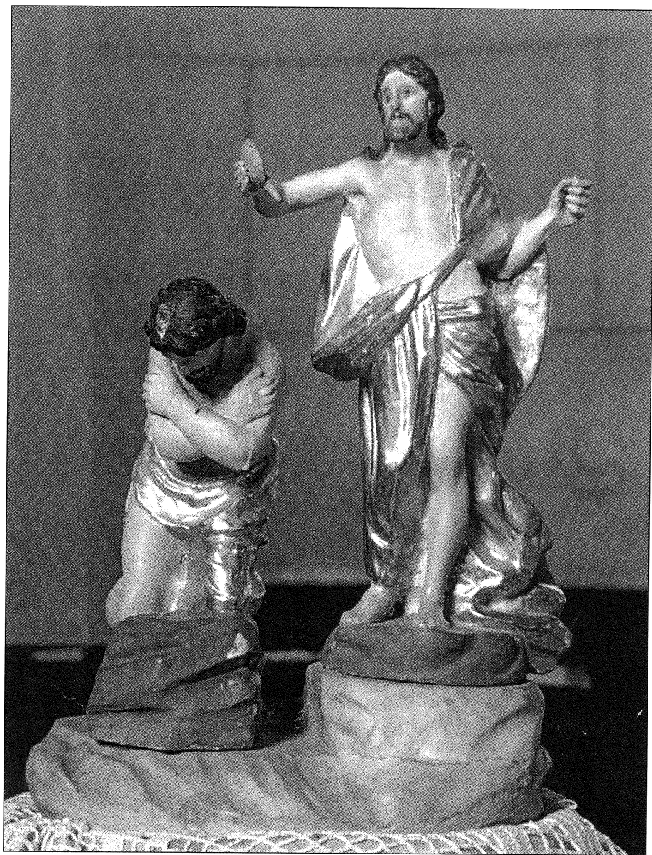
Johann Mnich Krisztus megkeresztelését ábrázoló szobra a harkai keresztel kúton.