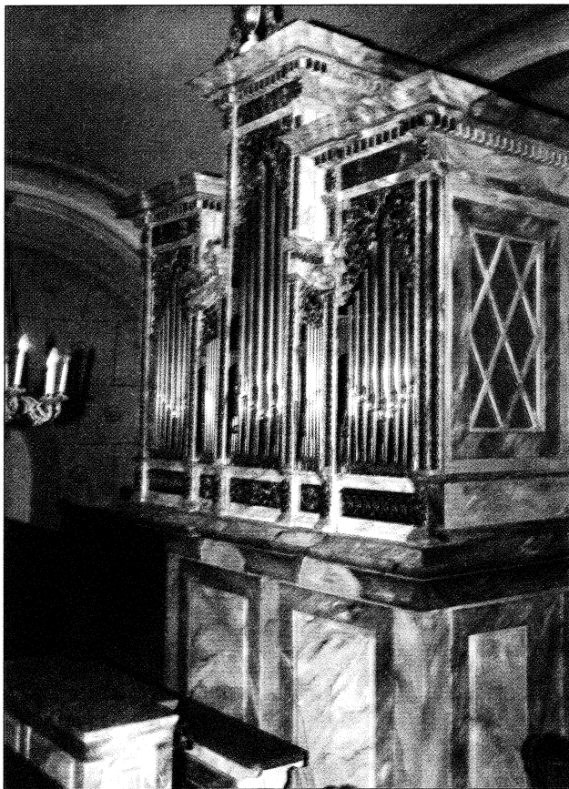
König harkai orgonája 1819-b l.

tek. 26 A gyűjtés azonban nem hozta meg a remélt eredményt, amiben az akkori rossz gazdasági helyzetnek is szerepe lehetett. Az 1903. február 15-i konventi