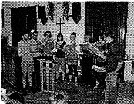
1. ábra. A tanfolyam tanárai.

Tapasztalatunk az, hogy a zsolozsma nem pótolja, hanem segíti az imádkozó életet. Rendszerességével olyan alkalom életünkben, amelyen nem beszélhetünk már „külsődleges elemekről” és belső, lelki tartalomról, mert ez a kettő eggyé válik: a fegyelmezett zenei teljesítmény, a rendezett liturgia az imádkozó közösségben találja meg értelmét.