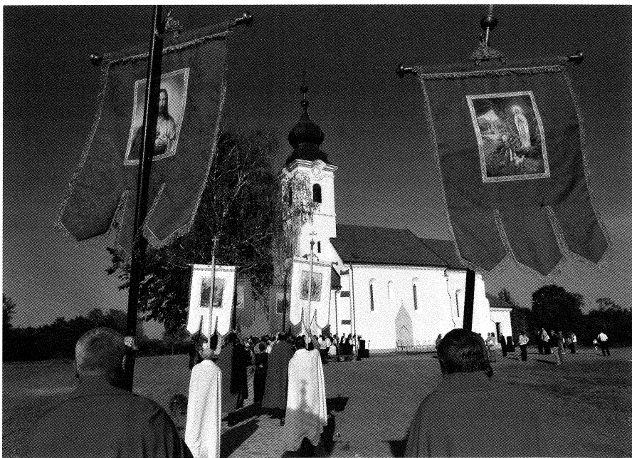
Fent: Ülőfülkék feltárása a zajtai középkori templomban.