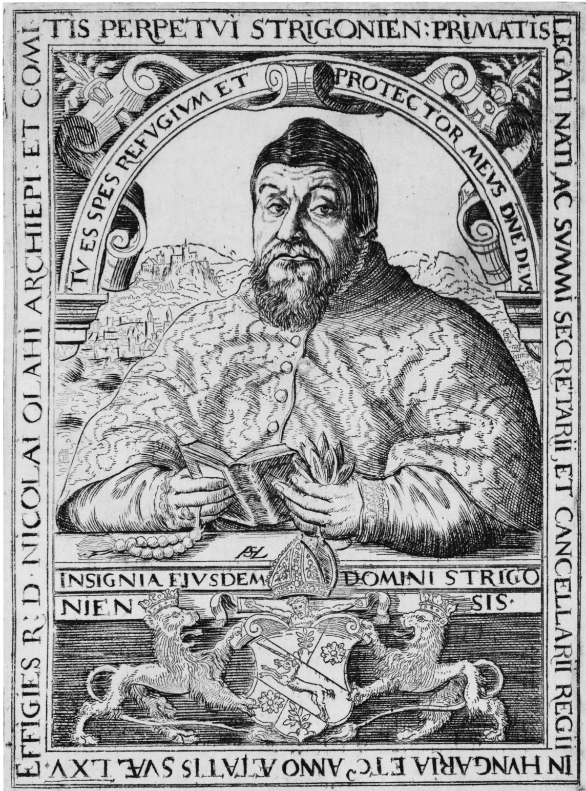
3. ábra. Oláh Miklós portréja a kilencedik, utolsó kiadásból.