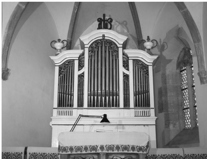
1. ábra: A gernyeszegi orgona (Samuel Binder, I+P/9, 1854).