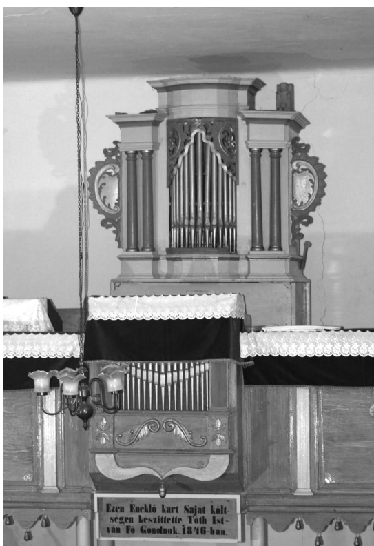
3. ábra: Árpástó egykori orgonája, ma az értarcsai református templomban (ismeretlen mester, 1/5, 1800 előtt).

Mivel a reformátusok elsősorban a szász gyülekezetektől vásároltak orgonákat, hasznos lenne ilyen kutatást végezni a szász evangélikus egyházban is. Az egyházak egymás közötti kapcsolatának a XVIII–XIX. században lényeges, sok esetben egyetlen tárgya volt az orgonák adás-vétele, ezért kijelenthetjük, hogy teljes képet csak akkor kapunk az erdélyi orgonaépítészetéről, ha a nyugati kereszténységhez tartozó mindegyik erdélyi történelmi egyházban végbemegetjük az orgonák hasonló kutatása. 5 Így nemcsak az itt épített orgonákról és orgonaépítő mesterekről kapnánk több adatot, hanem kiteljesedne az erdélyi református orgonatörténet is az ide került hangszerek „előtörténetének” ismeretével. Legyen e munka előrelépés e feladatban!