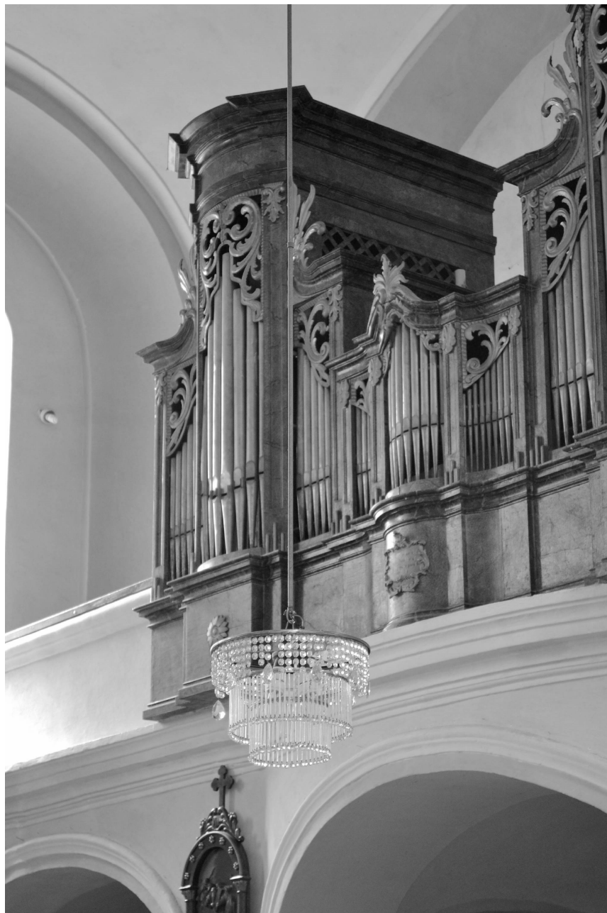
Pazsichky-orgona a szolnoki Szt. András-templomban (1879).